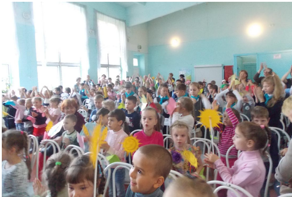
На фото (сверху вниз): 1. Команда волонтеров-семиклассников 2. Участники ДОИ