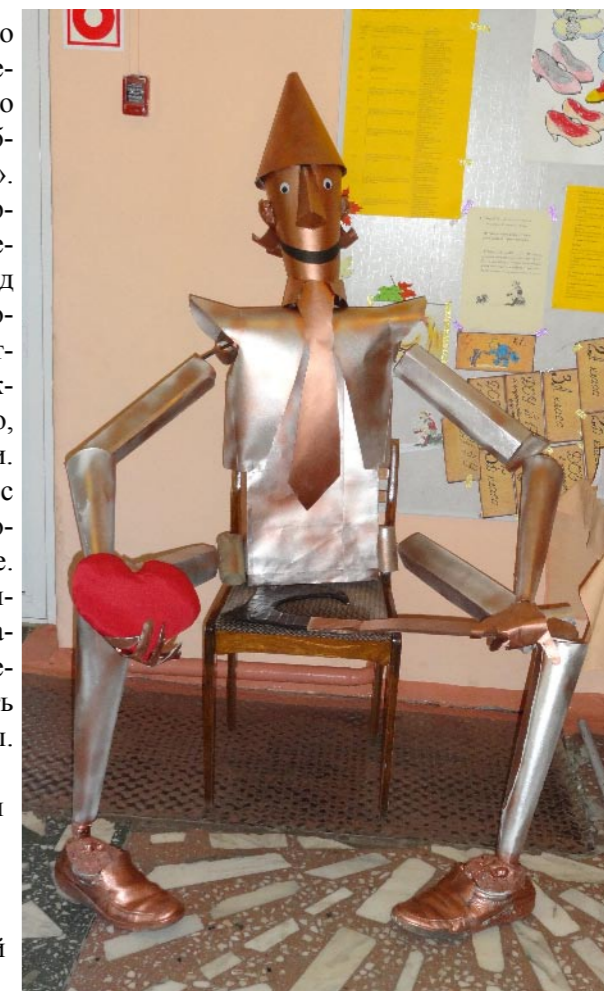
Страницу подготовила Ирина Ковалева